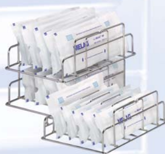
подставка для упакованных инструментов