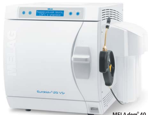
MELAdem® 40 установленный на автоклаве Euroklav® 29 VS+

Обслуживание автоклавов должно быть приятным и безопасным. Дизайн полностью соответствует этим требованиям. Он не только внешне привлекателен, но и рационален. Например, большой дверной запор не просто элемент дизайна, но и обеспечивает лёгкое и безопасное открывание и закрывание двери.