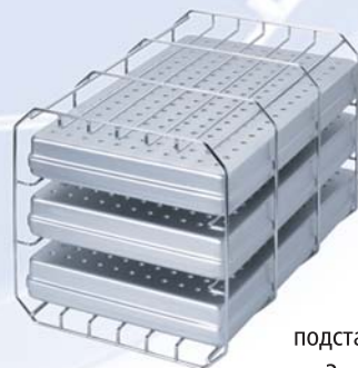
подставка типа А (повёрнутая на 90град.) на 3 стандартные кассеты