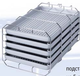
подставка типа А на 5 лотков

Автоклавы всегда поставляются с подставкой для лотков или кассет, включённой в стоимость. Обычно это подставка типа «А» (для 5 лотков или 3 стандартных кассет). Подставка для упакованных инструментов делает возможным вертикальную стерилизацию упакованных предметов для оптимальных результатов сушки.