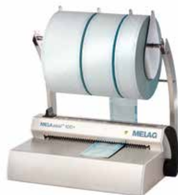
MELAseal® 100+ с рулонодержателем «комфорт»

Устройство MELAseal® 100+ позволяет легко и надежно запечатывать упаковку для стерилизации MELAfol®. MELAseal® 100+ позволяет без значительных физических усилий со стороны оператора делать герметичные швы шириной 10 мм (согласно стандарту DIN 58953 достаточно 8 мм). MELAseal® 100+ оснащается системой контроля температуры и длительности воздействия. Если температура и длительность воздействия будут недостаточными для запечатывания упаковки, устройство сообщит об этом при помощи звукового сигнала и светового индикатора.