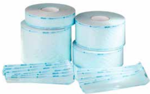
Упаковка MELAfol® поставляется в рулонах и пачках.

Эффективный способ избежать загрязнения простерилизованных инструментов – запечатать их в упаковку для стерилизации MELAfol®. Упаковка MELAfol® представляет собой сочетание бумаги и прозрачной пленки. Такая упаковка герметична для микробов, устойчива к износу и легко открывается. MELAfol® соответствует стандарту DIN EN 868-5.